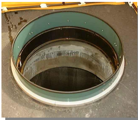
NTT新型マンホール取付け状態