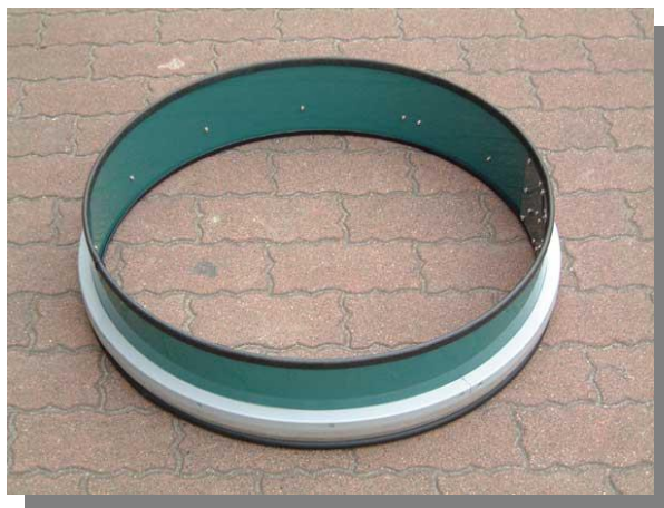
NTT新型マンホール用 防水枠